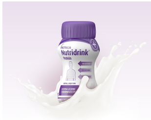
o smaku neutralnym